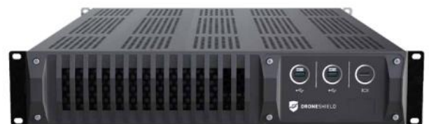
SmartHub MKII rack unit

Durabilidad mejorada: SmartHub se suministra con una carcasa IP67 que garantiza una gestión fiable del sensor en condiciones ambientales adversas. Los conectores de grado militar garantizan un funcionamiento ininterrumpido y la protección del medio ambiente en todos los entornos.